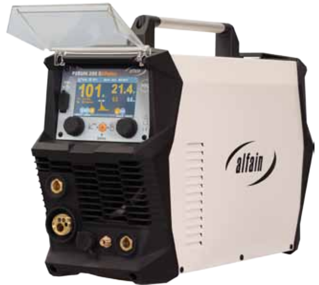
Osvětlení vnitřního prostoru Light of spool internal area