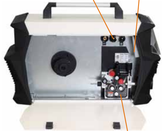
4-kladkový posuv 4-rolls wire feedern