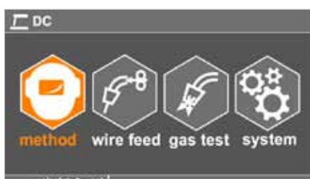
Hlavní menu / main menu