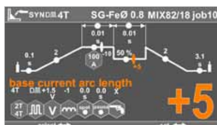
Nastavení sekundárních svař. parametrů / setting the secondary welding parameters