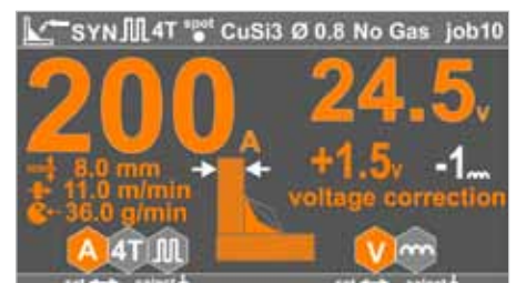
Nastavení svařovacích parametrů / setting of welding parameters